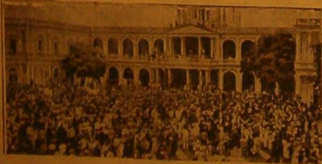
هتلر يلقي خطابه في برلمان على جمع حاشدة عند احتلاله الراين يعلن السياسة الجديدة