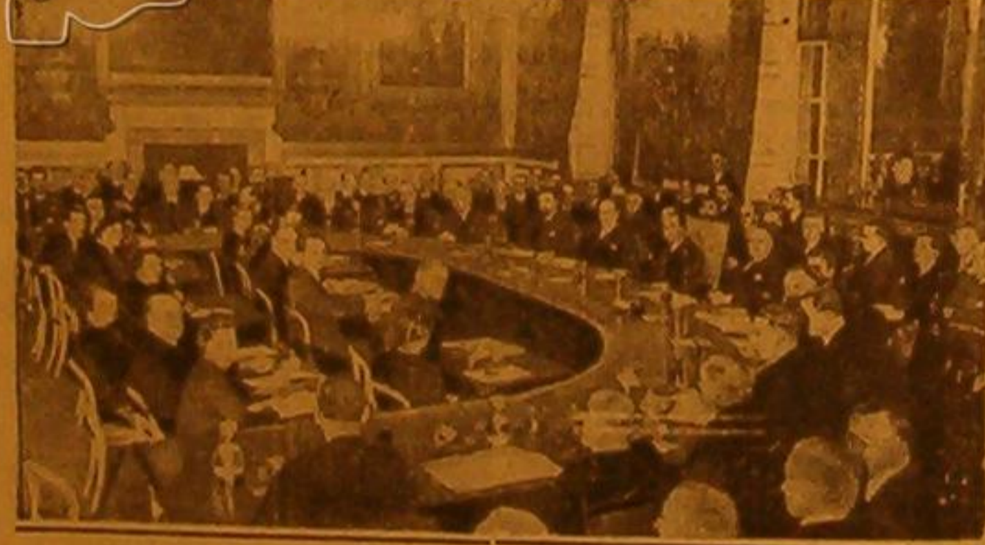
مندوبو دول لوكارنو وجلس العصبة في اجتماع في قصر سانت جيمس

ألقى وايزن خطبة في حق اليهود في لندن عرض فيها الحالة الحاضرة في فلسطين فقال ان البلاد في امكانها ان تستوعب عدداً كبيراً من المهاجرين لاسبيا المزارعين . ثم قال : «يجب ان يهاجر الى فلسطين في خلال خمسة عشر عاماً ٧٠ الف عائلة يهودية من المزارعين لان هذه العائلات تسحق مكانها لاستخدام ثلاثة اسطها في العمل فون ان يؤثر ذلك على بقية السكان»