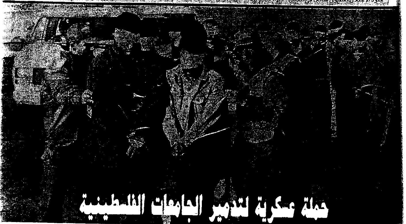
حملة عسكرية لتدمير الجامعات الفلسطينية