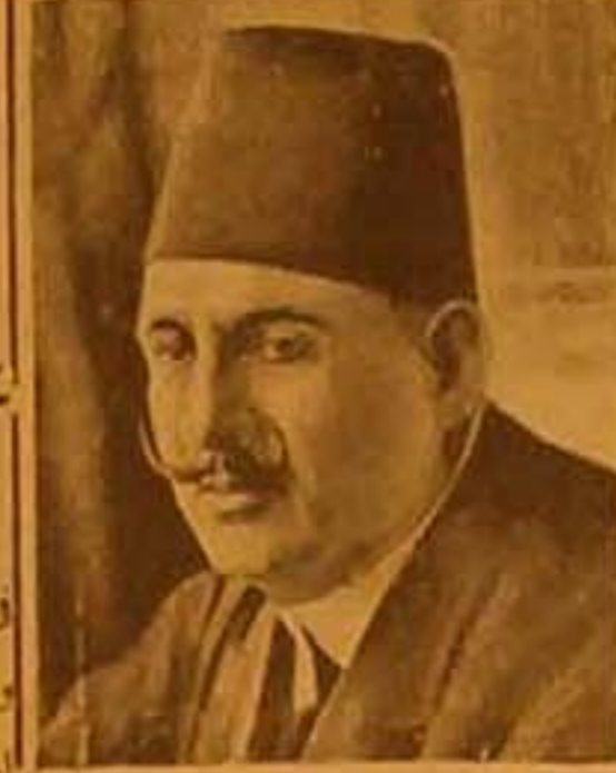
صحة الملك فؤاد

الساهرة في ٢٥ نيسان - لمراسل النمام الخاص : كانت صحة جلالة الملك فؤاد في الايام الاخيرة حتى ترايدت في حالته . وأسبغت حاله خطيرة جداً أمس . وفي صباح اليوم ، الاطباء اجراء عملية نقل الدم لجلالته . وقد تمت العملية . وشرح الاطباء بعد ظهر اليوم ان حالة جلالة الصحة العامة حسنة عليها بعض التحسن . وقد صدرت نشرة طبية عند منتصف ظهر اليوم جاء فيها ان الاطباء تمكنوا من ايقاف النزيف من النقرة . اما الالتهاب المتعقبي في الفم وما يصحبه من الفرغرينا والحمى فملا حله . وقد ازداد المتوسط العام في المورة الدموية زيادة عموسة نشرة طبية في المساء