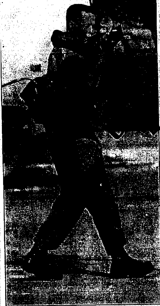
فناص يهدف القتل في نابلس