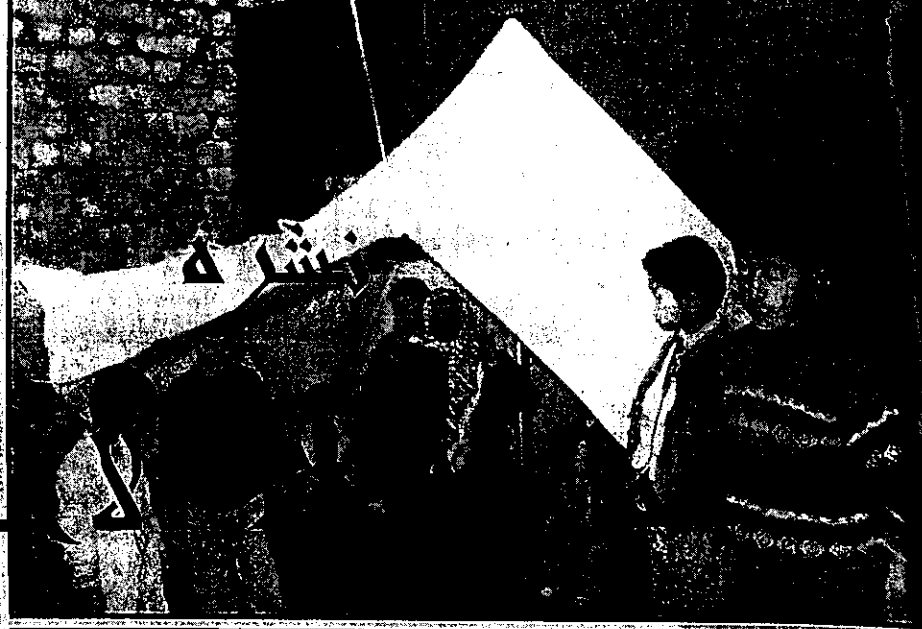
نشارة في خيمة قدمها لهم الصليب الاحمر